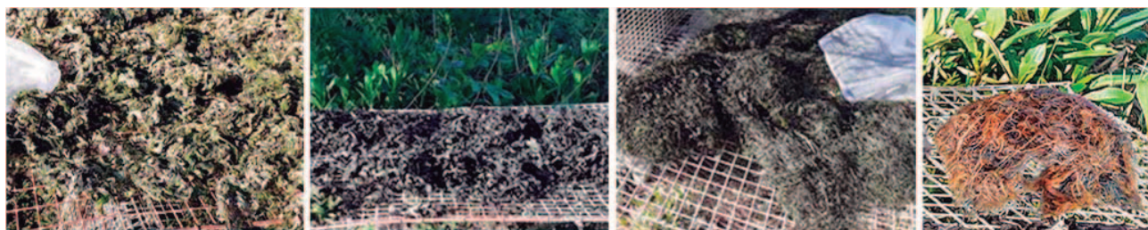
Experiencia de secado natural. De izquierda a derecha: Ulva lactuca , b) Fucus spp., c) Ulva intestinalis y d) Gracilaria spp.

Las cantidades recogidas en los lugares seleccionados (entre 0,5-2,5 kg/m 2 ) permitieron vislumbrar el poten-