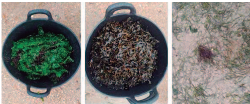
Especies de algas de arribazón recogidas. De izquierda a derecha: Ulva lactuca y Gracilaria spp.; Fucus spp.; y Ulva intestinalis

marina y su entorno de nuevas fuentes de energías renovables. Se fomenta así la adopción de una estrategia basada en los principios de economía circular, en donde el aprovechamiento de recursos como las algas depositadas en la costa, puede contribuir a la sostenibilidad de la actividad acuícola y a la adopción de una ventaja competitiva en su sector. De este modo, VALORALGAE propone reducir la dependencia de combustibles fósiles, reforzándose con ello la competitividad de la acuicultura a través de la I+D+i. Además, la sustitución de los combustibles fósiles por fuentes de origen renovable como pueden ser los biocombustibles obtenidos a partir de la materia orgánica procedente de las algas de arribazón permite disminuir las emisiones de CO 2 y contribuye a atenuar el impacto medioambiental. Por otro lado, con la recogida y valorización de estas algas también se evita su