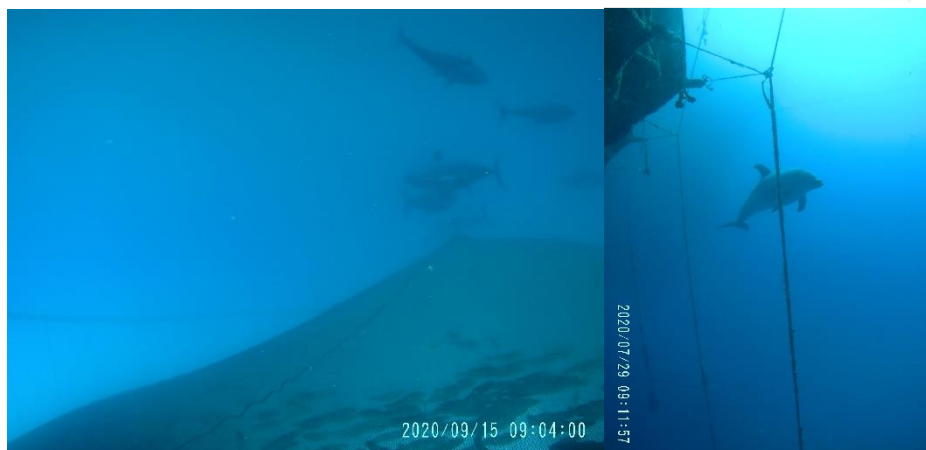
Grupo de atunes próximos a una jaula de acuicultura en Burriana (izquierda); Delfín mular ( Tursiops truncatus ) merodeando las instalaciones acuícolas de Tenerife (derecha).

Ha sido un año intenso debido al estado de alarma generado por la crisis sanitaria del Covid-19, pero, afortunadamente, el grupo PARAPEZ 2 ha podido continuar con sus muestreos, pese a que estos han tenido que comprimirse en el tiempo y reducirse, como también lo ha hecho, consecuentemente, el número de muestras.